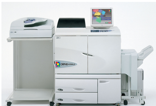
ORPHIS HC5500A・HC オフセットスタッカー ・RISOスキャナーHS2000