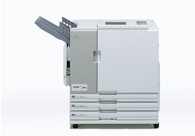
「新製品」 ORPHIS X9050