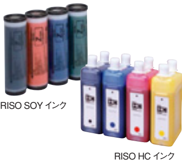
RISO SOY インク