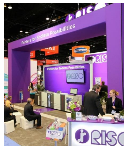
Print 17 (米国)