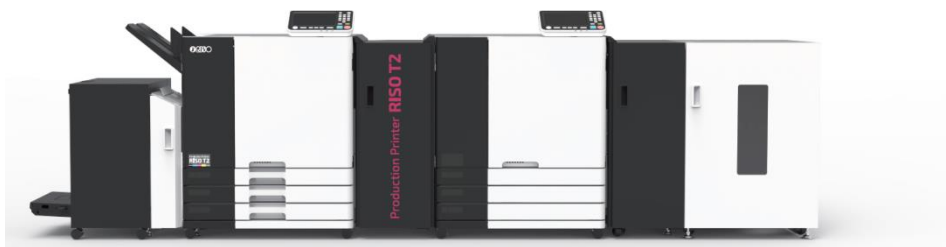
RISO T2 (カット紙プリンター)