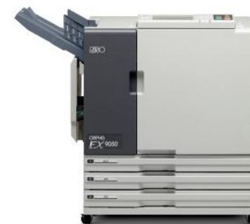
高速カラープリンター オルフィス