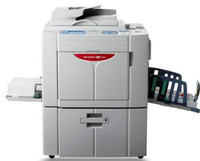
デジタル印刷機 リソグラフ