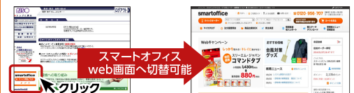
RISO Web オーダーシステム ログイン後の画面

RISO Web オーダーシステムからスマートオフィスのweb画面への切替は、クリック1つでログインできます。