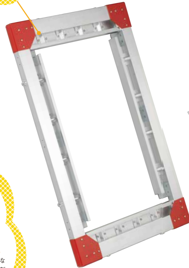
③マスターの長辺を固定し、横方向にもテンションをかける。