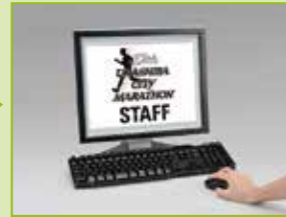
2 パソコンからデータを送信